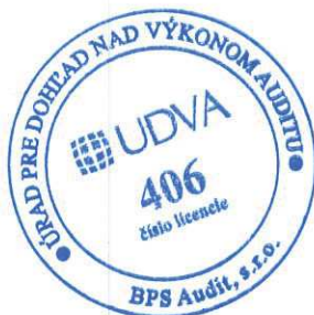
Zodpovedný audítor Mgr. Peter Šebest Licencia SKAU č. 960

BPS Audit, s. r. o. Licencia UDVA č. 406