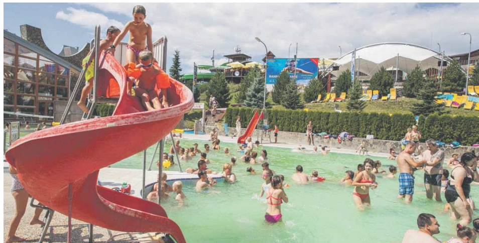
Otváranie wellnessa a kúpalísk je technicky a administratívne náročné a vyžaduje si dlhší čas na prípravu.