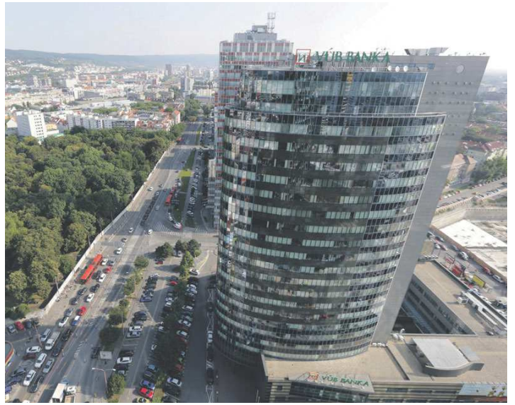
Finančné domy budú ešte pozornejšie prehodnocovať rizikovosť žiadateľov o pôžičku.